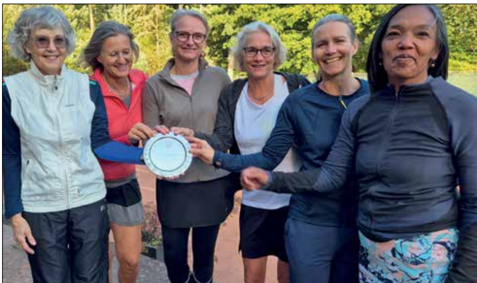
Vinderne fra BMI.